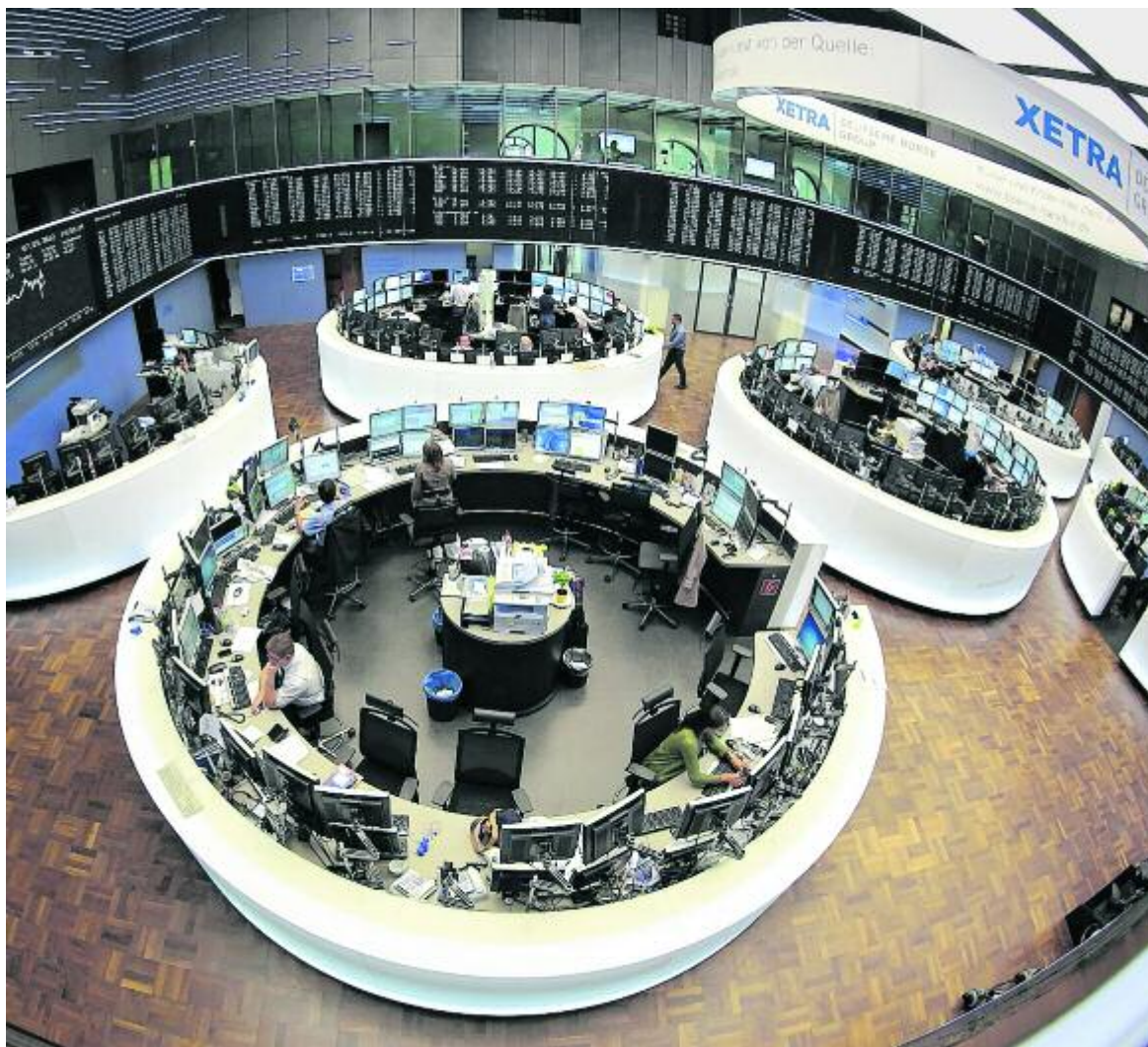
Viele Anleger haben sich an der Börse - wie hier in Frankfurt - verspekuliert.

CHEMNITZ - Im vergangenen Jahr ist das Geldvermögen der Deutschen um knapp 57 Milliarden Euro gestiegen. Dem soliden Anstieg der Geldvermögensbildung standen allerdings beträchtliche Kursverluste deutscher Anleger an den internationalen Börsen gegenüber.